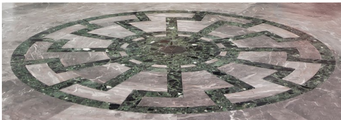
Simbolul Soarelui Negru în pardoseala "Obergruppenführersaal" (Sala Generalilor SS)

1945, sub ordinele lui Reichsführer Himmler, Wewelsburg a fost detonat pentru a-l proteja de armatele invadatoare. O parte din castel a scăpat și a fost restaurat în mare parte. Adevăratul Păgânism - care este sinonim cu Satanismul - este recunoscut pentru importanța majoră pe care o acordă Soarelui (666).