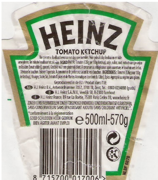
Exemplu de marcă (K)osher pe ambalaj de ketchup

Doar prin înștiințarea publicului despre taxa mâncării kosher și prin efortul de a ne abține de la a cumpăra produsele cu simbolurile „K” sau „U”, putem pune capăt acestei nelegiuri, care este săvârșită asupra oamenilor noștri. Cu puterea de cumpărare a banului din zilele noastre, care este din ce în ce mai mică, nu ne permitem să lăsăm această nelegiuire să continue la nesfârșit. În completarea articolului de mai sus, aș vrea să adaug că dacă acesta este insigna lor, atunci ce pun în mâncărurile care nu o conțin? Această insignă este mai mult decât „kosher”, ea înseamnă că mâncarea respectivă este în regulă de consumat pentru evrei. Din moment ce publicul Gentil nu cunoaște nimic despre toate acestea, nu înseamnă asta că mâncarea sănătoasă și cu ingrediente naturale este rezervată evreilor?