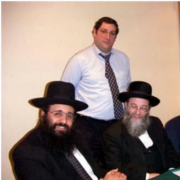
Una din echipele de rabini care verifică diverse companii, în vederea acreditării acestora pentru mărcile K sau U